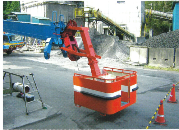
200T フルオートジブ取付

ボックスの外側は鋼板で囲い、高所における搭乗者の風よけと恐怖心を少なくしています